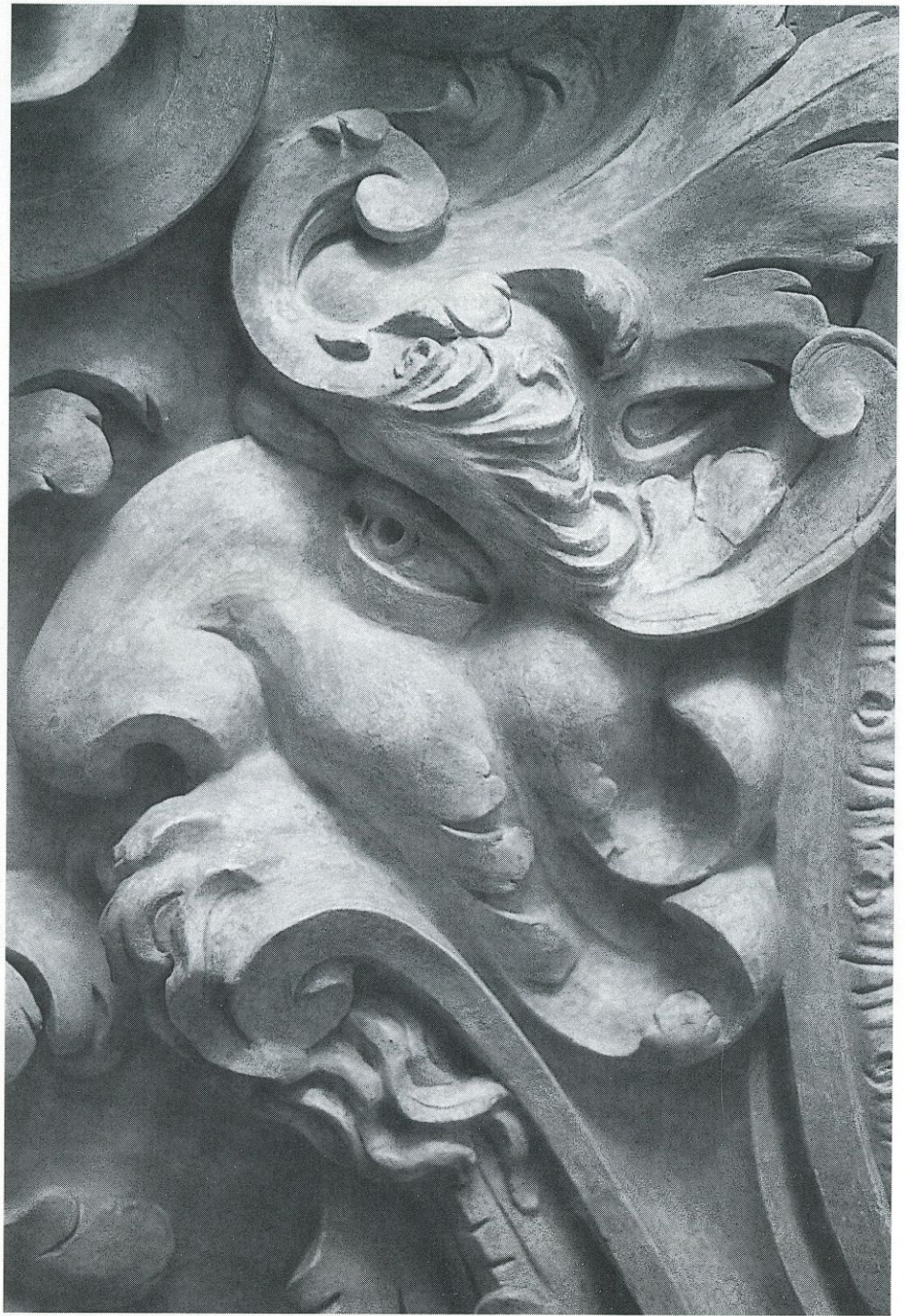
Abb. S. 203 rechts: Gewölbezwickel mit Medaillon „Kampf des Herkules“ im sogenannten Herkulesaal, während der Restaurierung.

Abb. S. 203 links: Wendeltreppe im Eck des nördlichen Gartenhofs (vgl. Abb. S. 161); Gewände und Rahmung der Fenster, nach Restaurierung.