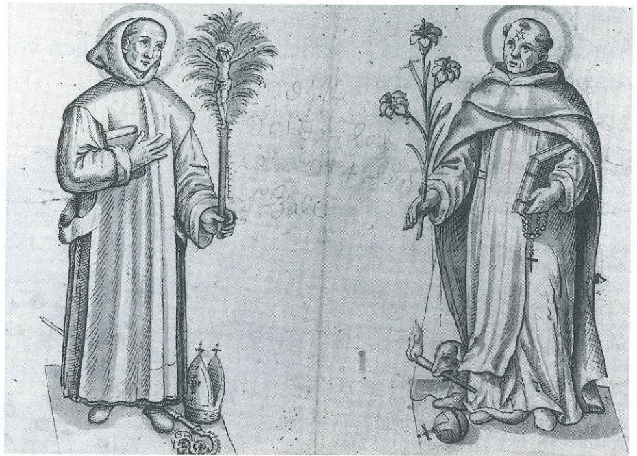
Abb. 3: Hl. Bruno und Hl. Dominicus, um 1635; (2 und 3:) Schlägl, Stiftsammlungen.