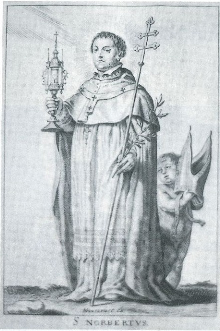
Abb. 2: B. Moncornet, Hl. Norbert; vor 1628.