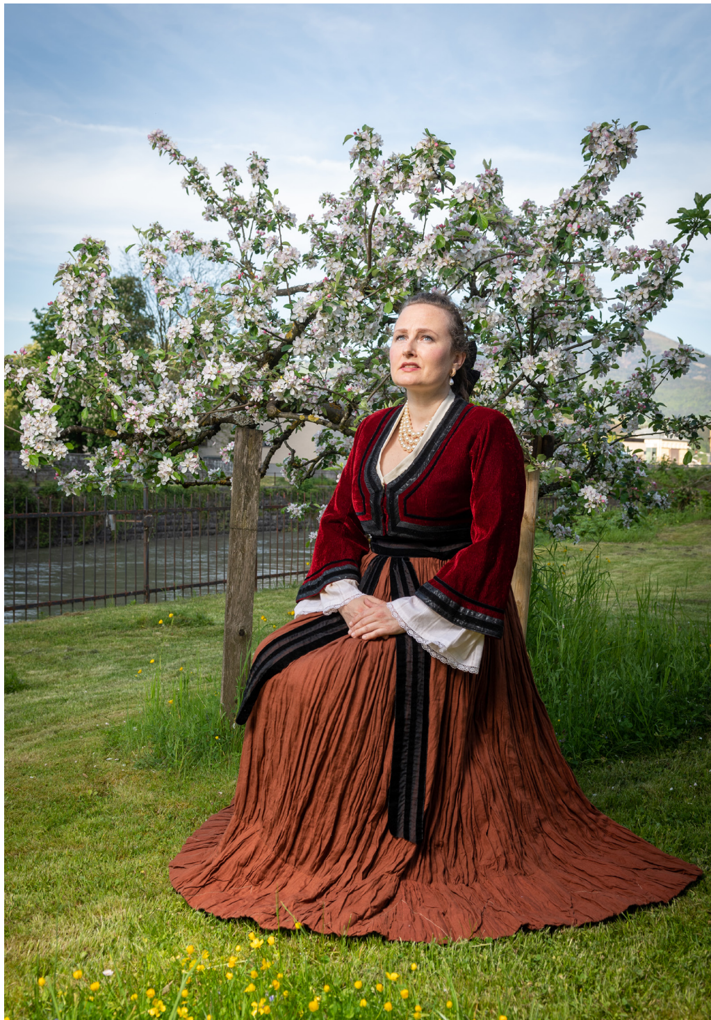
Bei einem Stadtrundgang lernen Sie historische Persönlichkeiten kennen und erleben Hallein aus einem anderen Blickwinkel.

22 Samstag, 22. Juni, 18 Uhr Lebendige Geschichte(n) Historische Persönlichkeiten erzählen Darstellerischer Stadtrundgang