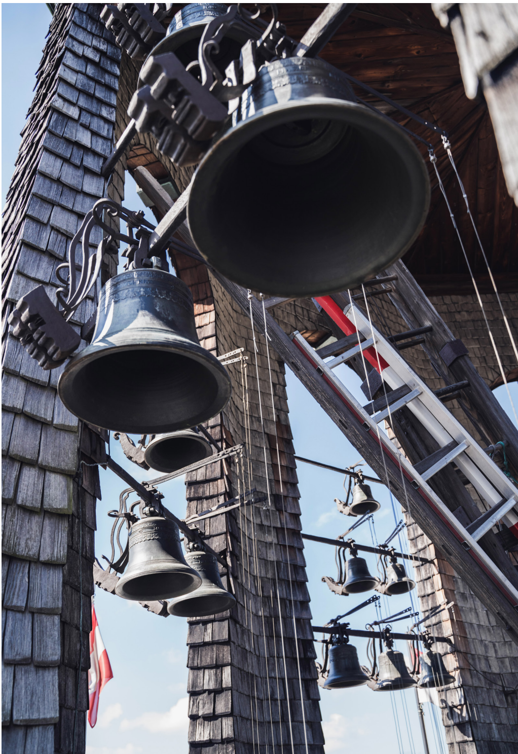
Herrliche Klänge und traumhafte Aussichten kann man bei einer Führung auf den Glockenspielturm genießen.