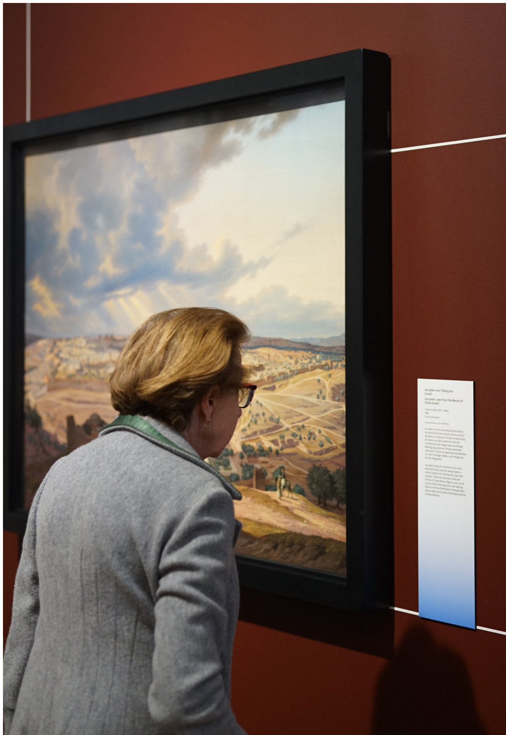
Begeben Sie sich mit den Kosmoramen von Hubert Sattler auf eine Reise zu heiligen Orten in aller Welt.