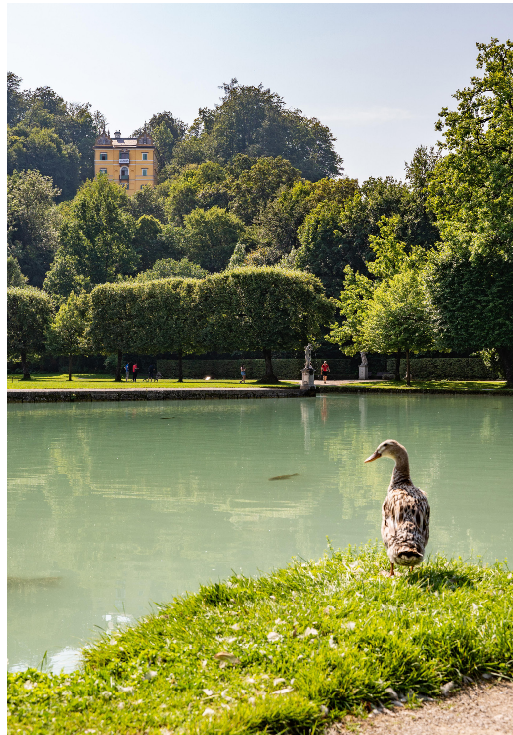
Seit 100 Jahren immer einen Ausflug wert ist das idyllisch gelegene Volkskunde Museum im Monatsschlössl.

Information: Renate Wonisch-Langfelder, renate.wonisch-langfelder@salzburgmuseum.at , +43 662 620808-719