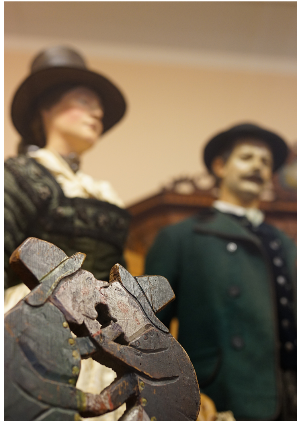
Masken, Trachten und Kultobjekte der Volkskundlichen Sammlung gibt es in der Jubiläumsausstellung im Monatsschlössl zu entdecken.

Anna Engl Die Kuratorin gibt Einblicke in die neue Ausstellung im Monatsschlössl. Unter welchen Aspekten wurden volkskundliche Objekte vor 100 Jahren gesammelt? Wie blicken wir heute auf diese Sammlung? Womit identifizieren wir uns und was ist fremd geworden? Anmeldung erforderlich: kunstvermittlung@salzburgmuseum.at oder +43 662 620808-723 Führung kostenlos zzgl. Museumseintritt