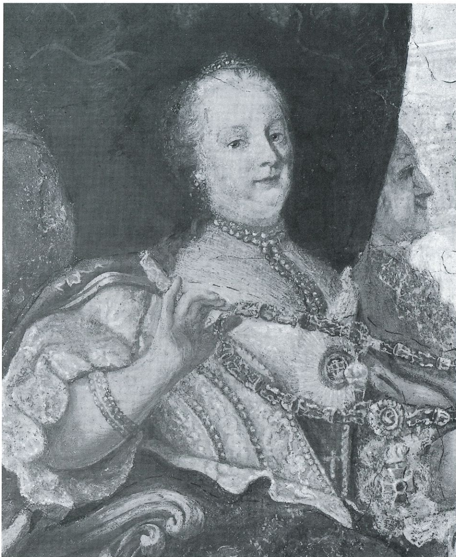
Abb. links: „Die Königin von Ungarn verleiht den Stephansorden“, Detail aus dem Deckenfresko auf Seite 232.